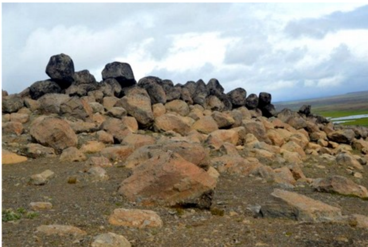
Val byl postaven z kamenů a zeminy a zpevněn byl dřevem.

Val je dnes již značně rozpadlý a vlivem zemědělské činnosti se stále zmenšuje. V dobách svého vzniku byl však na některých místech až 16 metrů široký a na výšku měřil šest až osm metrů. Byl postaven z kamení a zeminy a zpevněn dřevěnými palisádami a trámy. V některých místech jej tvoří obrovské kamenné bloky, jejichž manipulace by vyžadovala větší počet lidí a dobře organizovanou práci.