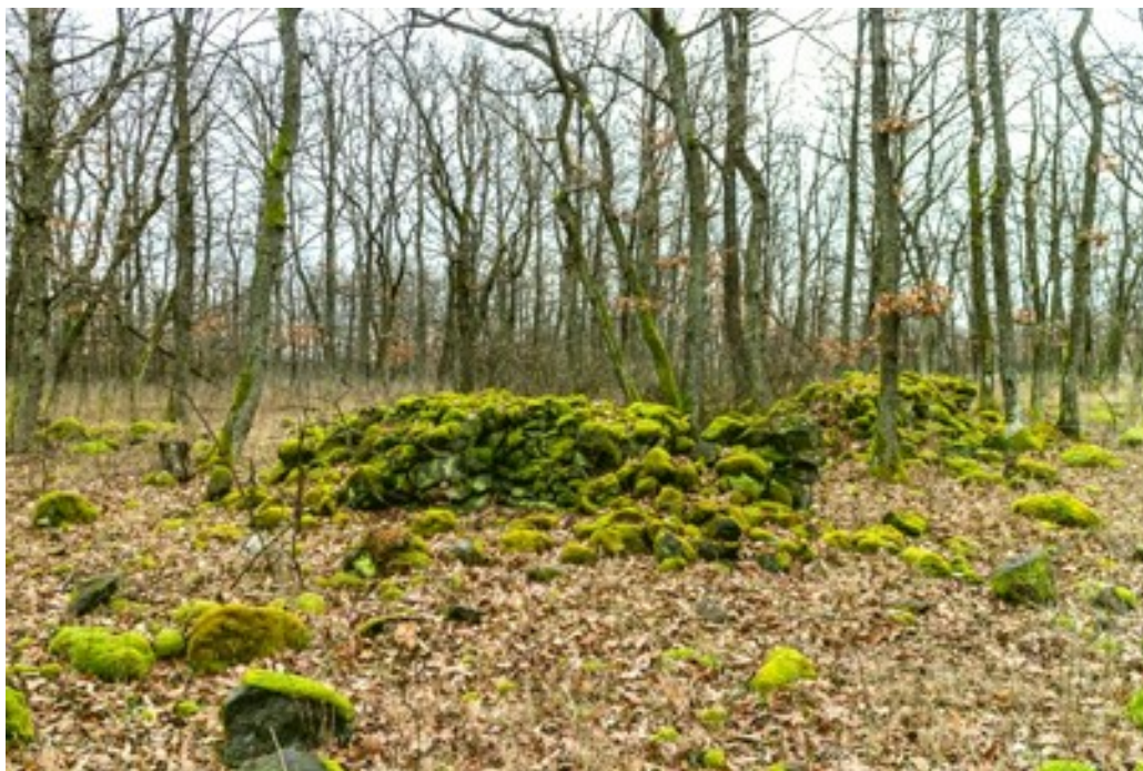
Dochované zbytky valu v lese.

lidových pověstí val postavili čerti. Existují však mnohem smělejší teorie. Znamý slovenský záhadolog a amatérský historik Ján Hurník například tvrdí, že jde o vůbec nejstarší lidskou stavbu na světě, starší než jsou egyptské pyramidy! Ve svých úvahách jde dokonce tak daleko, že Val obrů spojuje se staroislandskými mytologickými písněmi zvanými Eddy a rozpoznává v něm onen mýtický Vingridův val, kde obr Surtr bojoval s bohy, jak popisuje Píseň o Vaftrudnim: „Vingrid je val, kde budou bojovat Surtr (což je obr) a bohové, sto měří mil každým směrem...“