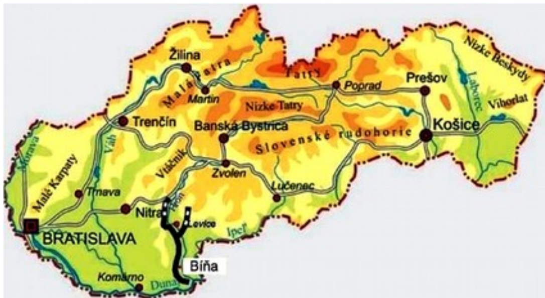
Mapa s vyznačením místa stavby.